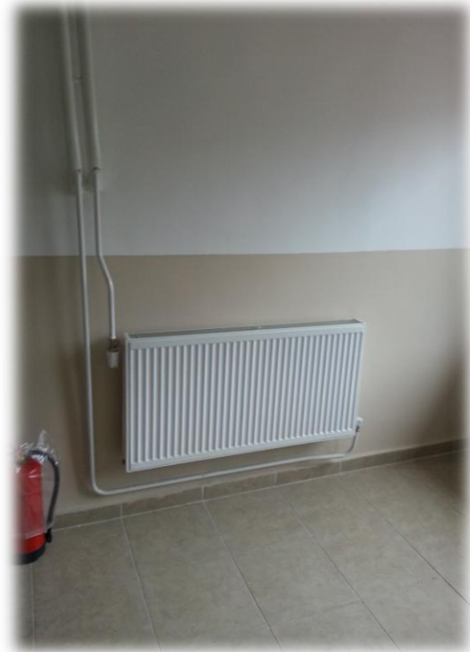
Merkez Yerleşke'ye Yapılan Kazan Dairesi ve Kaldırıcı Tesisatı