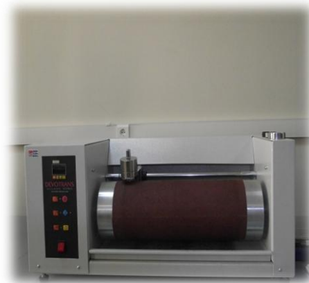
Aşınma Test Cihazı