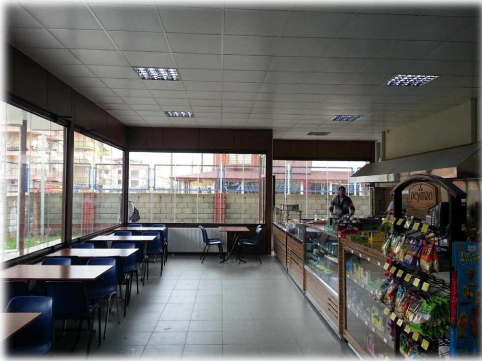
Yalova Meslek Yüksek Okulu'na Yapılan Kantin