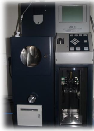
Distilasyon Test Cihazı