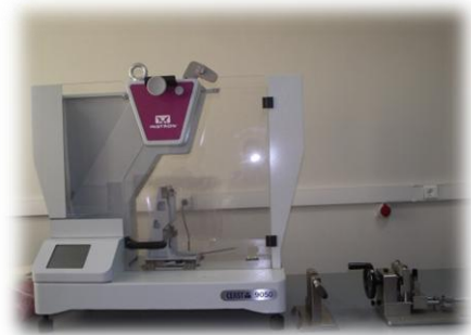
Darbe Dayanımı Test Cihazı