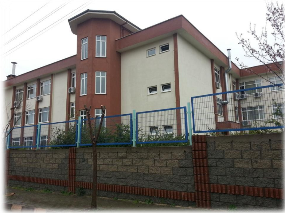
Yalova Meslek Yüksek Okulu'nun Dış Cephe Boyası Yapılmış Hali