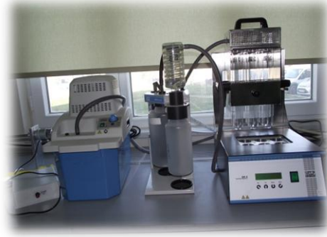
Azot Tayin Cihazı