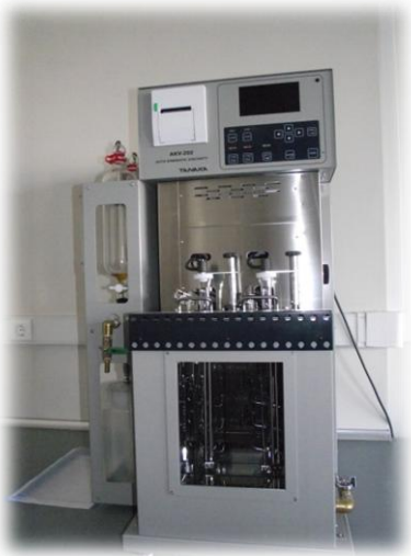
Kinematik Viskotize Tayin Cihazı