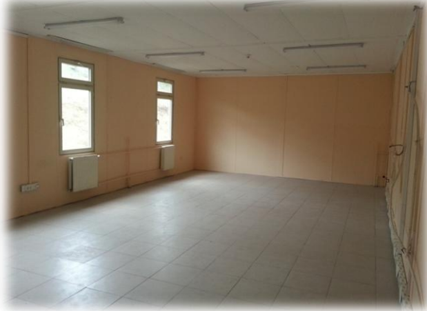
Altınova Meslek Yüksek Okulu Büyük Onarımına Ait Görüntüler