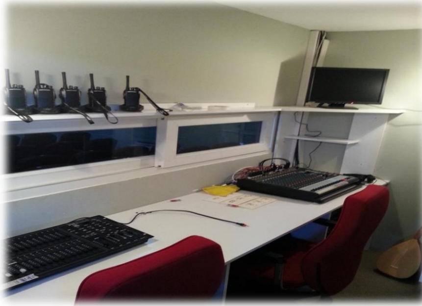
ALIM YAPILAN EKİPMANLAR