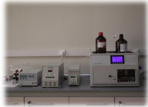
Jel Geçirgenlik Kromatografi (GPC)