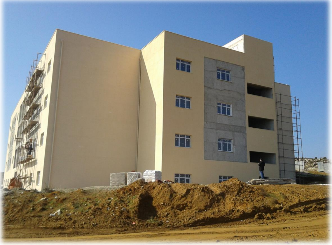
ARMUTLU MESLEK YÜKSEK OKULU İNŞAATI