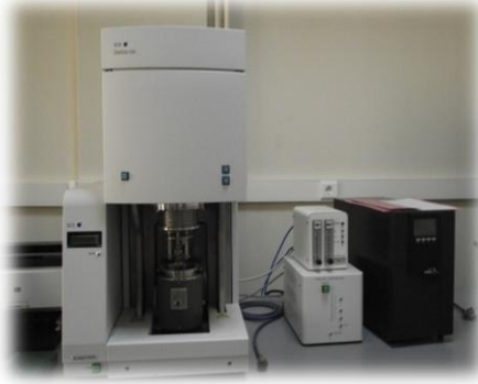
Dinamik Mekanik Analiz Cihazı