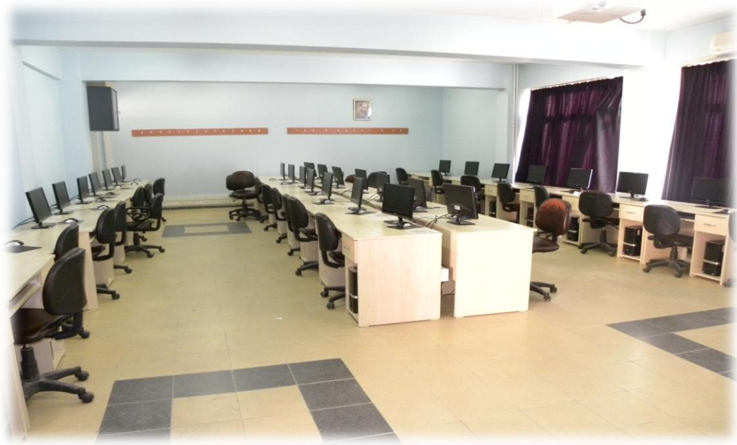
Bilgisayar Laboratuvarlarımızdan Görüntüler