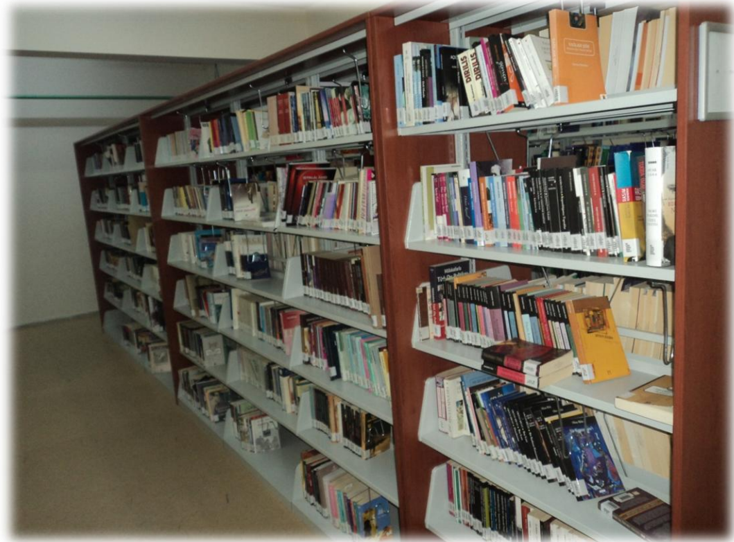
Üniversitemiz Kütüphanesinden Görüntüler