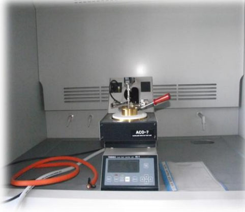
Açık Kap Flash Point Cihazı