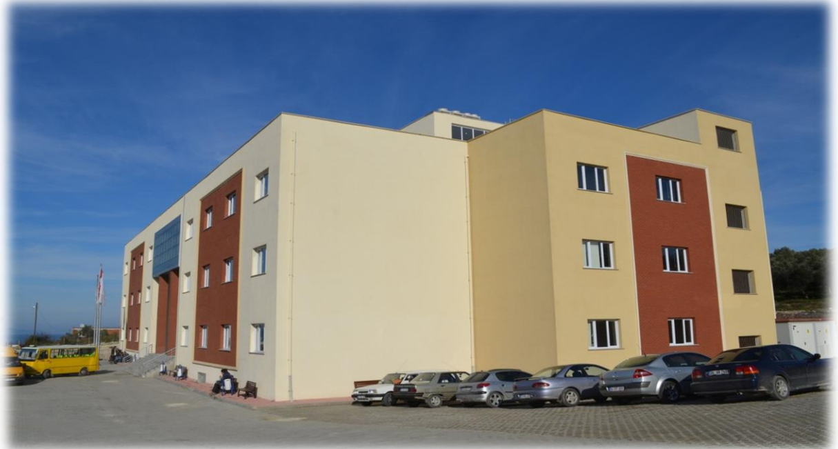
ÇINARCIK MESLEK YÜKSEK OKULU